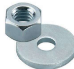
Moer en onderlegging